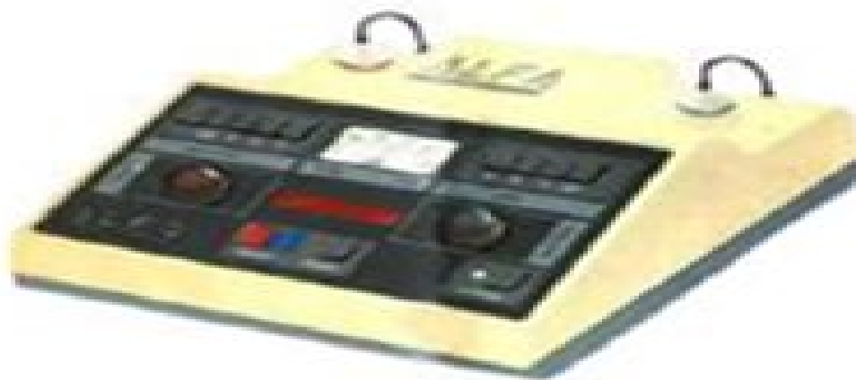
Рисунок 1. Лазерный терапевтический аппарат "Альфа 1М"