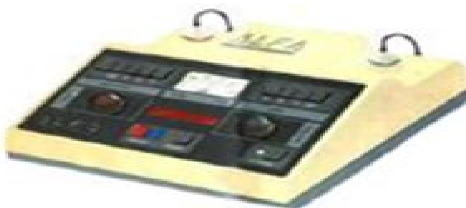
Рисунок 1. Лазерный терапевтический аппарат "Альфа 1М"