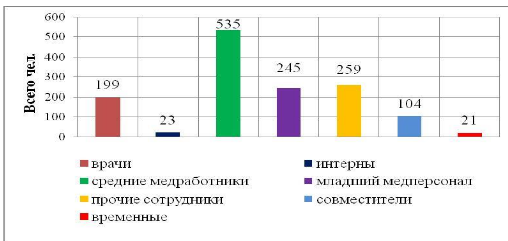
Рисунок 2. Численный состав персонала Кировской областной клинической больницы (абс.)