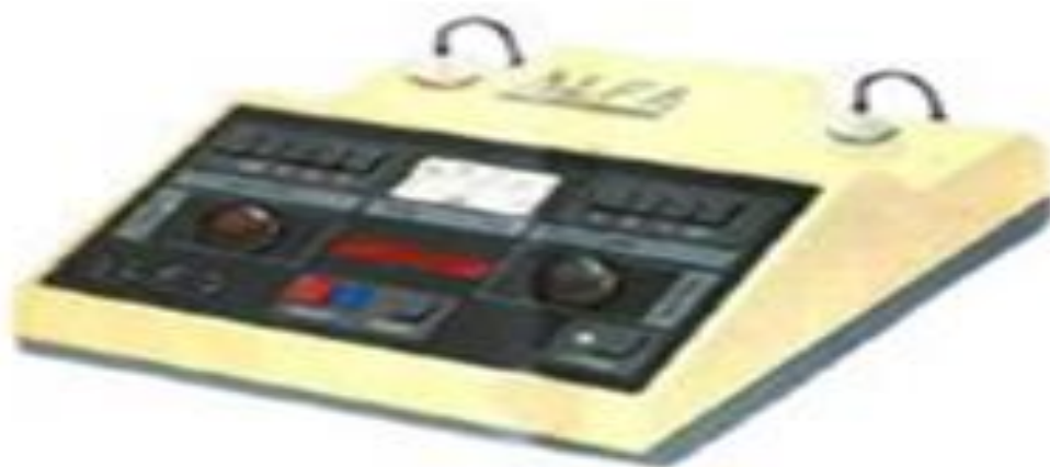
Рисунок 1. Лазерный терапевтический аппарат "Альфа 1М"